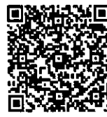
▲ 東華之音臉書官網